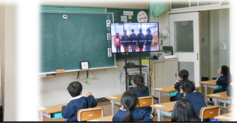
緊急事態宣言下の「1年生を迎える会」～6年生が放送で楽しい会を～