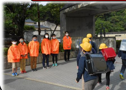
毎週月・水・金曜日「挨拶運動」をする児童会本部役員の子も達