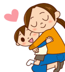
親子のふれあい・お話時間

などをしていただいたおかげだと思います。各ご家庭では、これからも忙しい日々の生活が続きますが、子どもたちへのご指導と関わりのお時間をどうぞよろしくお願い申し上げます。