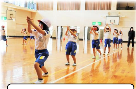
5月13日（木）運動あそび（1年）