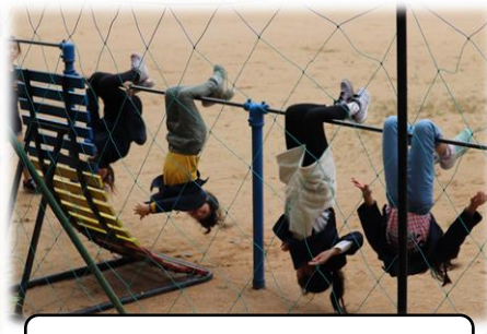
昼休み鉄棒遊びをする子ども達