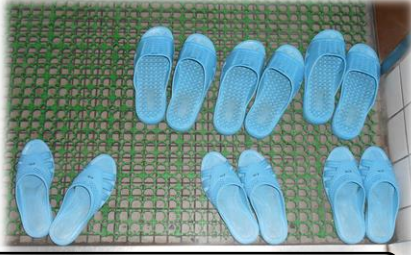
1年生トイレスリッパ揃え