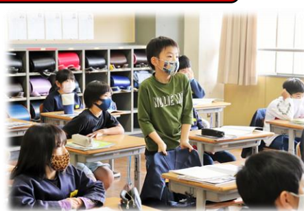
4月22日（木）授業参観（4年）