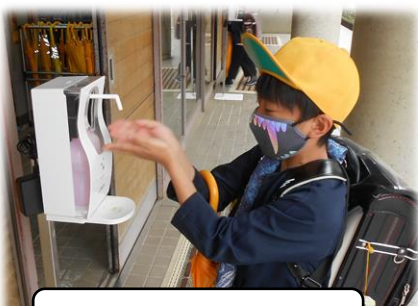
手指消毒・マスクの慣行